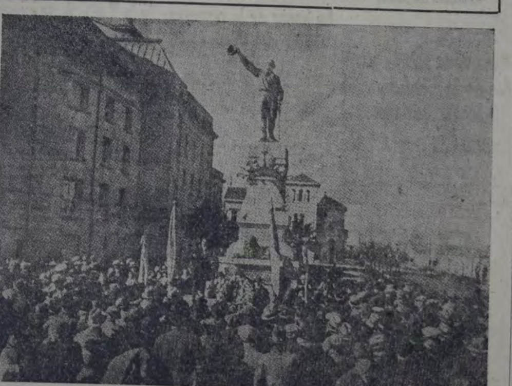
RECIENTEMENTE INAUGURADO EN ESA CIUDAD PARA MARTIRIO DE FASCISTAS Y FRAILES, SE dieron cita, con motivo del 46. aniversario de la muerte del incansable luchador, los ciudadanos y trabajadores libres, sin distinción de nacionalidad que reafirmaron así su fe en el porvenir de la democracia y su adhesión a los ideales de libertad y de justicia que orientaron la fecunda existencia del prócer.

dad de un valor de $ 350.001 y pesos 500.000. c) Del 3 por 1.000 sobre toda propiedad cuando su valor esté comprendido entre $ 500.001 y $ 700.000. d) Del 4 por 1.000 cuando el valor esté comprendido entre $ 700.001 y $ 850.000. e) Del 5 por 1.000 cuando el valor se halle entre $ 850.001 y $ 1.000.000. f) Del 7 por 1.000 cuando el valor esté comprendido entre $ 1.000.001 y $ 1.500.000. g) Del 9 por 1.000 cuando el valor es superior a $ 1.500.000. El P. E. abrirá una cuenta especial en el Banco de Córdoba, que se denominará "Fondos para la educación", donde se depositará cada quince días el dinero recaudado por este concepto y el que sólo se aplicará para los fines establecidos en la presente ley.