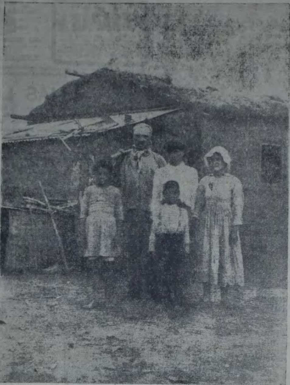
HE AQUI UNA ELOCUENTE FOTOGRAFIA QUE NOS HABLA DE LA MISERIA EN QUE VIVEN NUESTROS TRABAJADORES DEL CAMPO. Este chacarero que no conoce más ley que el trabajo diario y brutal, se encuentra, ya en el ocaso de su vida, tan pobre y desamparado como el día que nació.