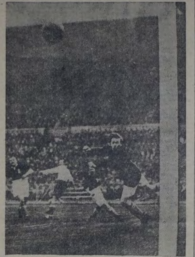
CRAWFORD, GUADAVALLA DEL BLACKBURN ROVERS, CON UN PUNTO SALVA A SU ARCO DE UNA SITUACION APREMIANTE.

Cuatro minutos más tarde el capitán de Blackburn Rovers recibió la Copa de Inglaterra, igualando así al récord del Aston Villa, quien la ganó también seis veces. Blackburn la ganó en 1884, 85, 88, 90 y 91.