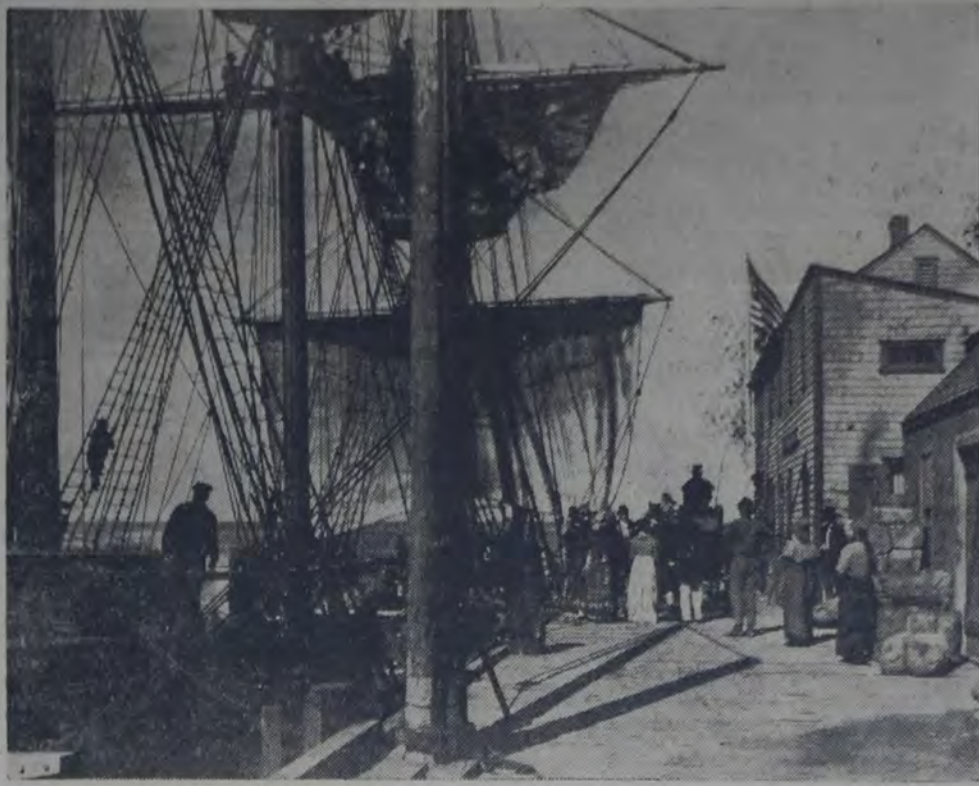
UNA ESCENA DE "LA FRAGATA INVICTA", PELICULA "PARAMOUNT", QUE SE ESTRENARÁ EL MARTES PRÓXIMO.

Hay en "El amor de Schahrazada" pensamientos profundos expresivamente dichos; hay apóstrofes en que se ad- vierte el acento de quien está familiariz- ado con la lectura de los viejos profetas bíblicos; hay madrigales que con- tienen deijos de la miel de Omar Kayan; hay utilidades maduras en la poética y perfumada quietud de las noches arábi- cas; y hay también resignadas sabidurías de derviche, explosiones desespe- radas de simoun, frescas ternuras de fontana poética.