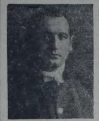
HA SIDO VICTIMA DE LOS PROCEDIMIENTOS ABUSIVOS DE LA EMPRESA TRANVIARIA "Eléctricos del Sud".

Tranviaria Eléctricos del Sud, fundada el 10 de septiembre del año último, y de la cual soy en la actualidad secretario general.